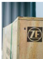
Driveline per sollevatori telescopici